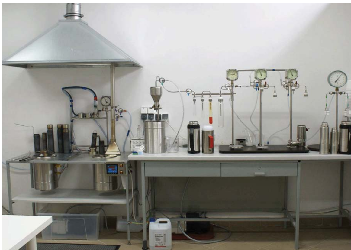
One recently equipped laboratory. Complete set. (Одна недавно укомплектованная лаборатория. Полный набор).