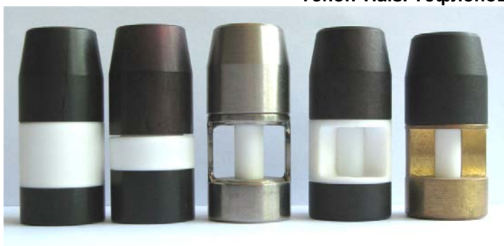
Teflon vials. Тефлоновые виалы.