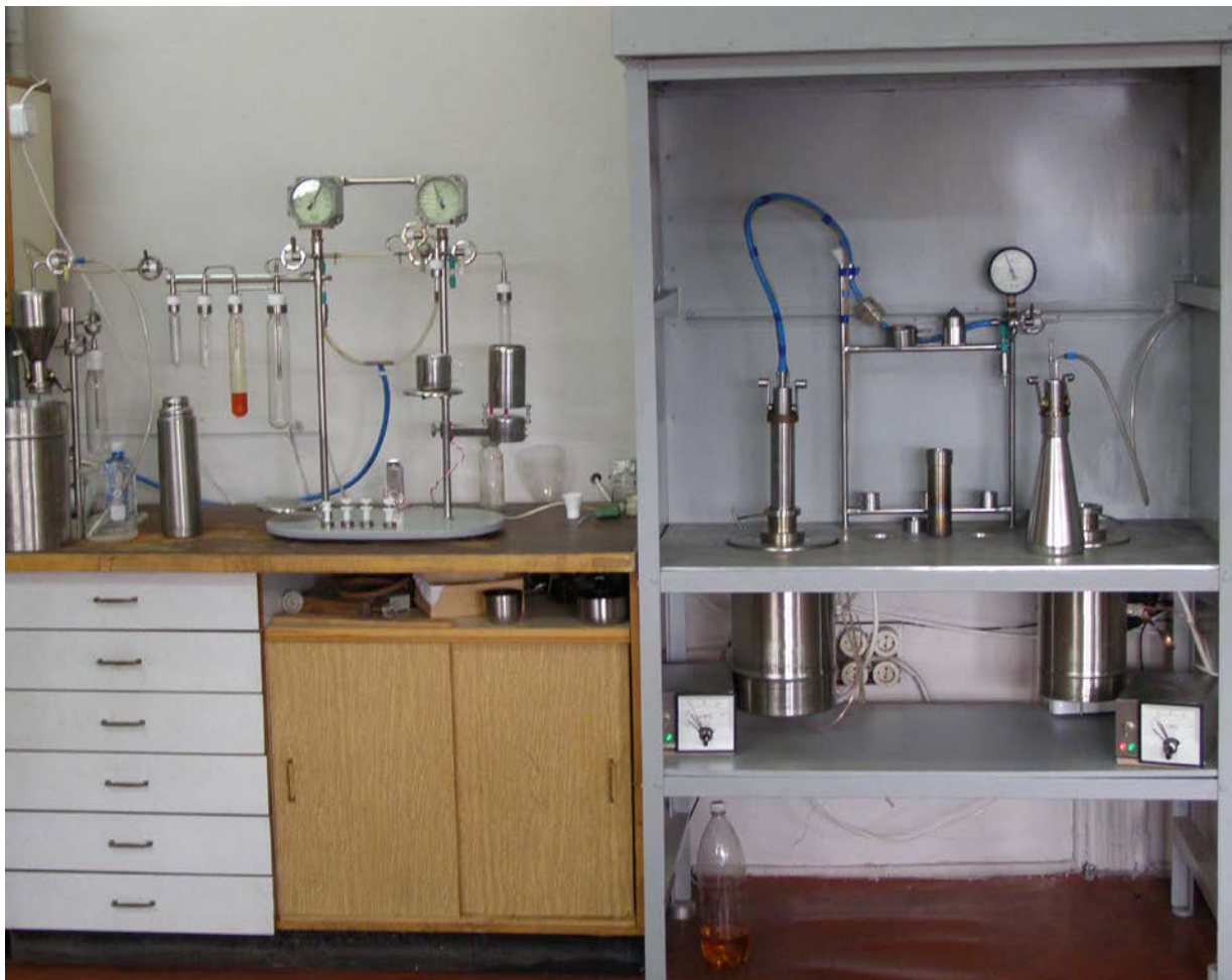
Another fully equipped lab. (Другая полностью оборудованная лаборатория).